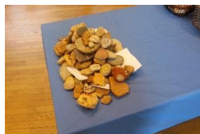
Cairn construit au cours de la célébration

La date du prochain week-end de rentrée est fixée du vendredi 3 au 5 octobre 2014. Et l'assemblée Générale aura lieu dans la foulée le dimanche 5 octobre.